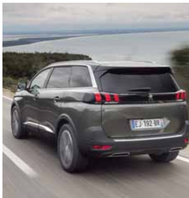
Líneas y trazos limpios pero definidos en la parte baja. Los rines presumen de un pulido muy cuidadoso y llevan neumáticos para todo tipo de clima. | PEUGEOT