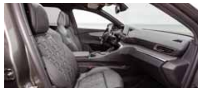
Los asientos y materiales son de acabado premium. Los mandos y controles están muy bien posicionados y dotan al conductor y pasajero una atmósfera de placer. | PEUGEOT