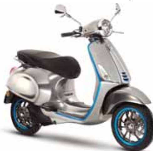
Vespa-Elettrica-2018: La nueva tecnología de movilidad eléctrica de Grupo Piaggio: personalizable, limpia, silenciosa y conectada | PIAGGIO MÉXICO

La Vespa Elettrica tiene una pantalla TFT a color de 4.3 pulgadas entre los manubrios que muestra