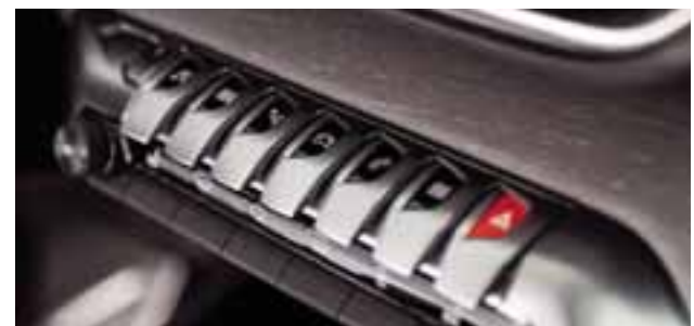
Detalles premium como los controles encontrados en el interior del vehículo, hacen que la sensación de manejar un 5008 sea muy especial.