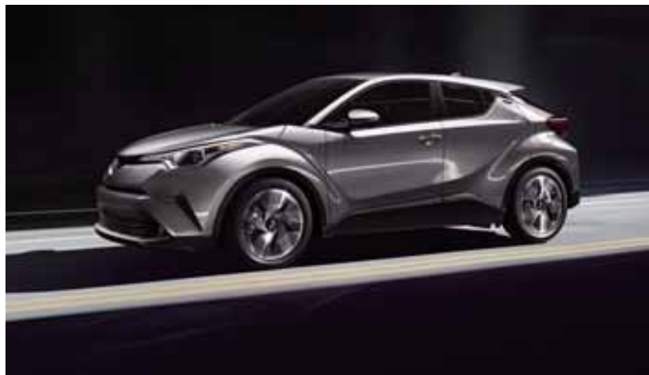
Toyota-C-HR-2018: Toyota C-HR llega a México en una sola versión con caja CVT y a 359 mil 900 pesos. | TOYOTA

En primera instancia Toyota C-HR se mete de lleno a la pelea en uno de los segmentos que más crece a nivel México: los crossovers subcompactos. Y sí, no hay que llegar primero, pero hay que saber llegar. Se trata de un vehículo lanzado en Japón en noviembre de 2016. El mismo es desarrollado en la planta de Turquía, de Toyota. Este ejemplar responde al nombre de Compact High Rider, por si se lo preguntaban, y está disponible en diferentes versiones de motorización. Sin embargo, para México tendremos una única versión, 7 colores de carrocería disponibles 7 bolsas de aire y una mecánica que destaca. Se trata de un 2 litros de 4 cilindros y 148 caballos acoplado a una caja CVT para brindar mejor eficiencia y dinamismo. Llega a México con control de tracción, asistencia de frenado, control de estabilidad y asistente de pendientes. Además, frenos ABS con discos ventilados al frente y sólidos en el eje trasero. Posee rines de 17 pulgadas