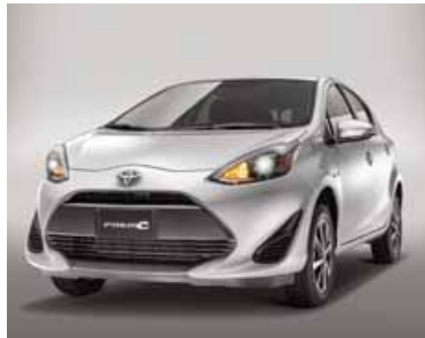
Toyota-Prius-C-2018: Toyota Prius C se ofrecerá en nuestro país en una única versión de 319 mil 400 pesos.