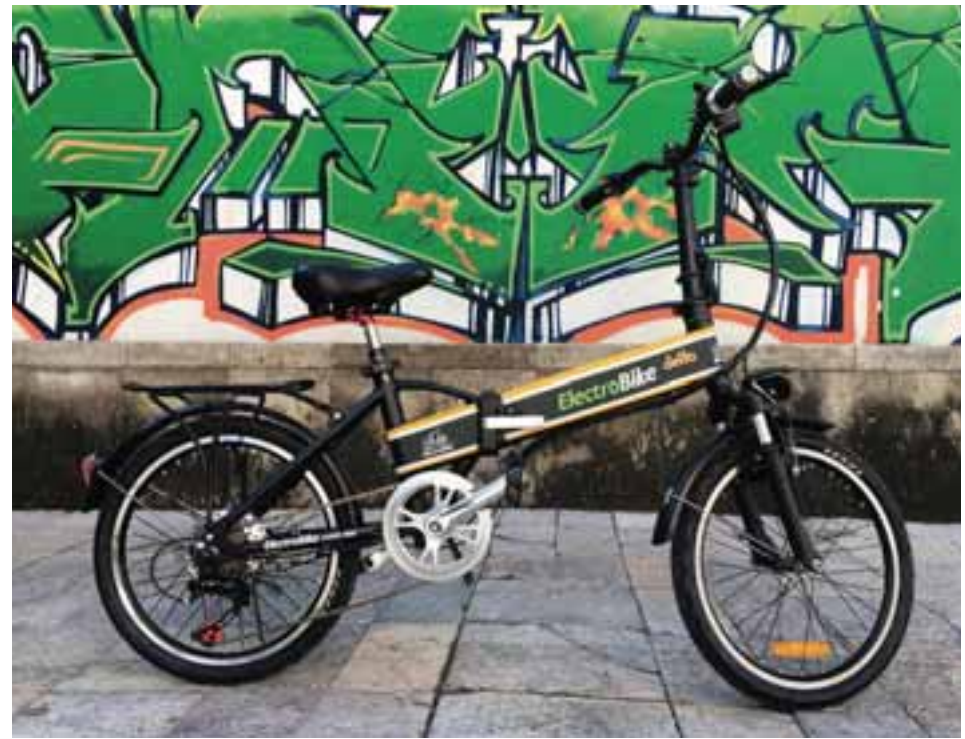
Esta alternativa de movilidad contribuye a la salud y al medio ambiente. | ELECTROBIKE