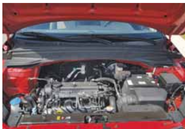
El motor cumple muy bien en todo momento y el consumo es muy bueno. | MR