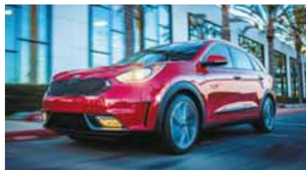
Las líneas versátiles de este auto se hacen acompañar de un desempeño a prueba de fuego.

Cabe destacar que este modelo está a unos días de arrancar su comercialización en México, por lo que este logro de KIA no pasará desapercibido para quienes busquen exprimir hasta la última gota de hidrocarburo de sus tanques.