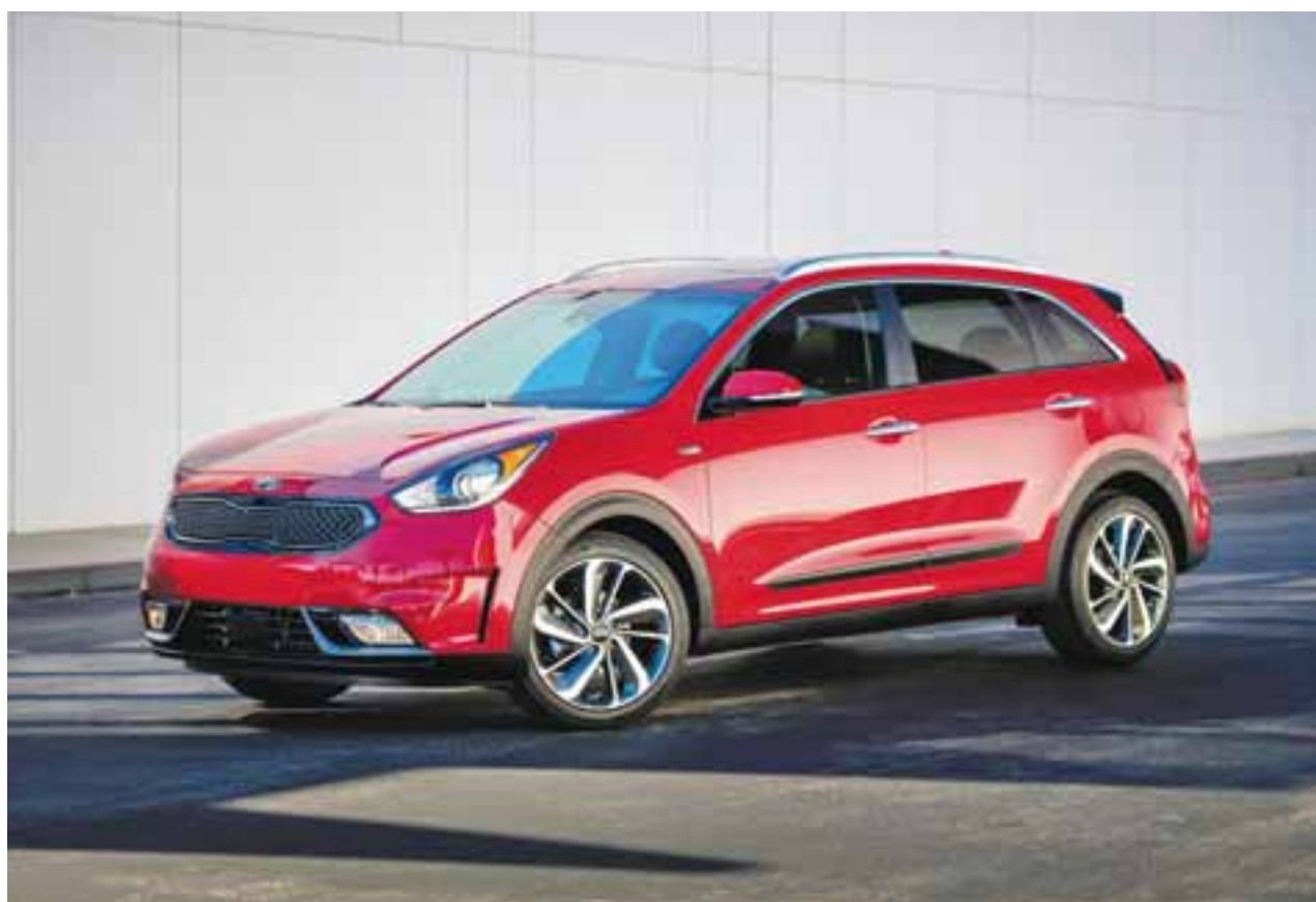
Este vehículo híbrido arrancará su comercialización en enero y con este logro se convierte en un referente del rendimiento. | KIA

Si anda buscando innovación, respaldo en todo el país, confiabilidad y espacio para su familia, amigos y demás invitados, ubicado entre 560 mil a 745 mil, la Pathfinder ya es necesaria en su canasta de compra. Sobresale, diseño, equipo y valor. En este segmento nunca compre si no se sube usted mismo a las tres filas de asientos y evalúe el área de carga con la tercera fila plegada y puesta. La transmisión CVT, piérdale el miedo, cada día funcionan mejor.