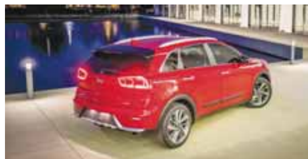
El ADN de los recientes lanzamientos de la marca están presentes en este modelo híbrido que se ha distinguido por su ahorro de combustible. | KIA