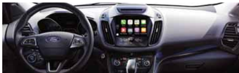
El cuadro de instrumentos ahora es de mucha más fácil lectura y manipulación en sus mandos.