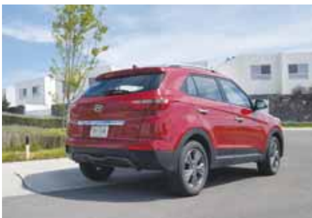
La parte trasera no pierde el aire de sus hermanas mayores, es elegante.

La dirección es precisa y nos permitió llevarlo a donde apuntaba nuestra mirada con controles de tracción y estabilidad que nunca perdieron el aplomo, lo que nos brindó una sensación de manejo muy segura en asfalto mojado, terracería y al hacer los rebases propios de carretera.