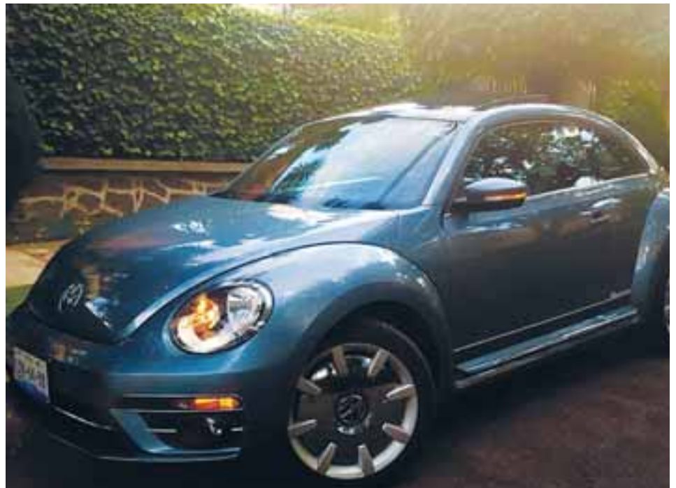
El look de este representante de Volkswagen es moderno y vanguardista, además de contar con múltiples detalles exclusivos de esta versión.