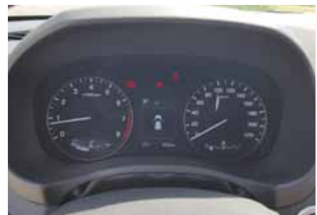
El cuadro de instrumentos es claro y ofrece información correcta y precisa. | MR