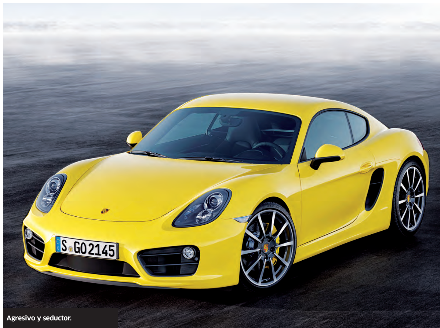
Agresivo y seductor.

pantalla de 4.6 pulgadas, asientos delanteros deportivos, encendido automático de luces con cambios de largas a cortas y viceversa, alerón trasero desplegable automáticamente y rines de aluminio de 18 pulgadas, entre otras muchas opciones.